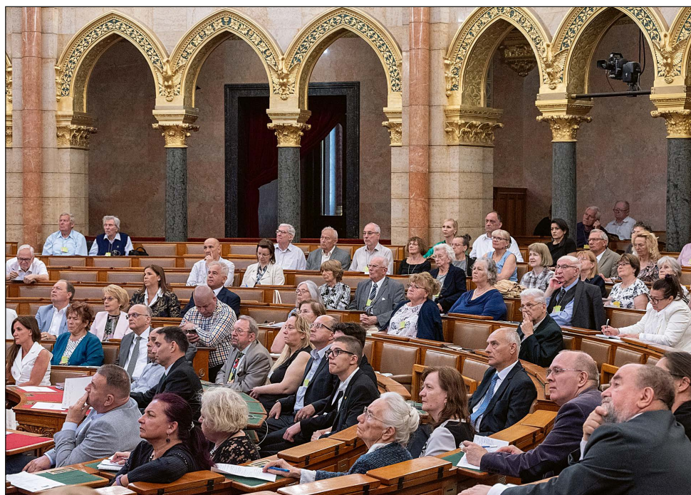
A 28. Keresztény Civil Fórum közönsége a Parlament felsőházi termében.