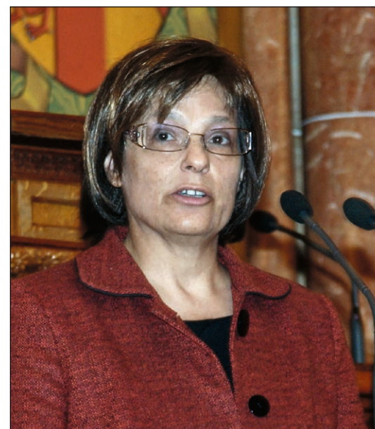
Szalay Annamária, az NMHH és a Médiatek elnöke