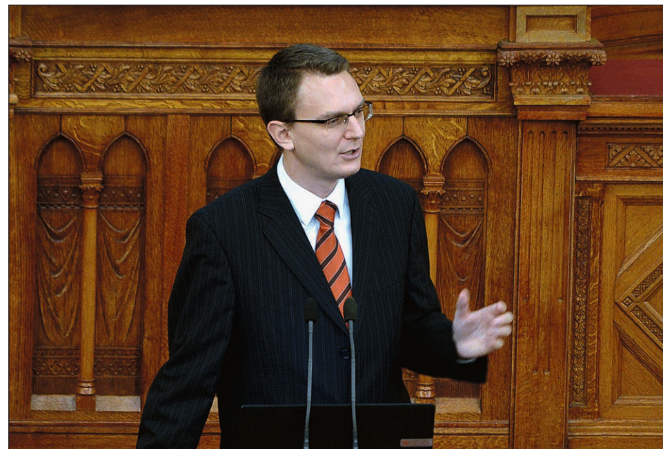
Rétvári Bence államtitkár, jelenleg belügyminiszter-helyettes