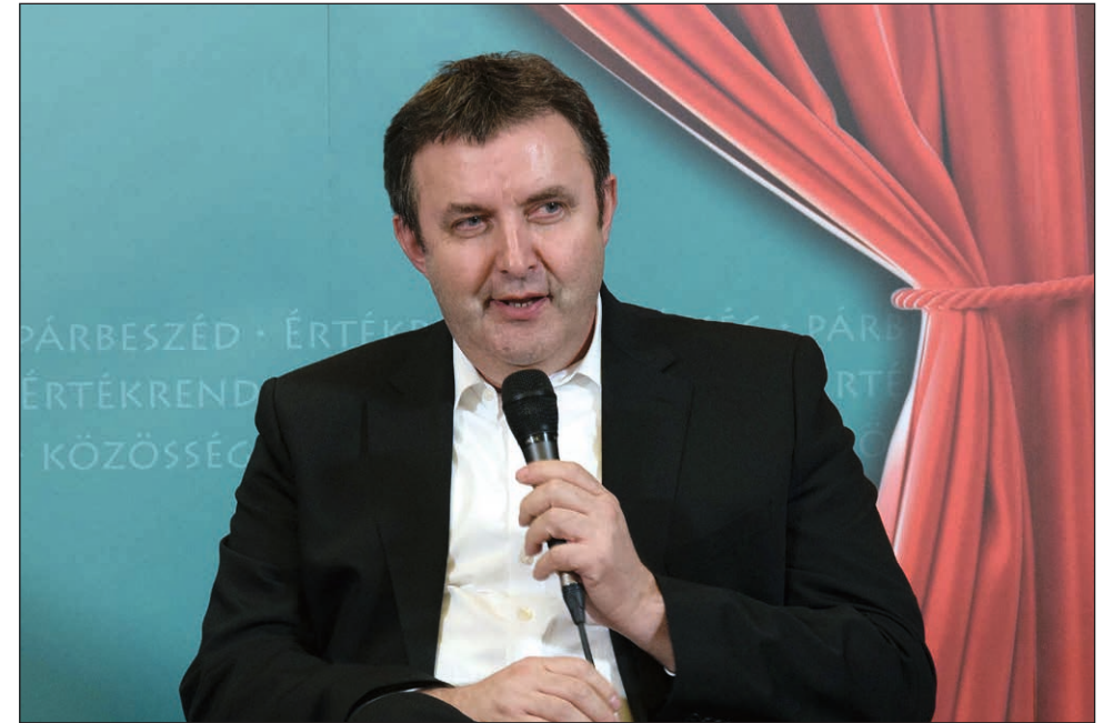
Palkovics László innovációs és technológiai miniszter