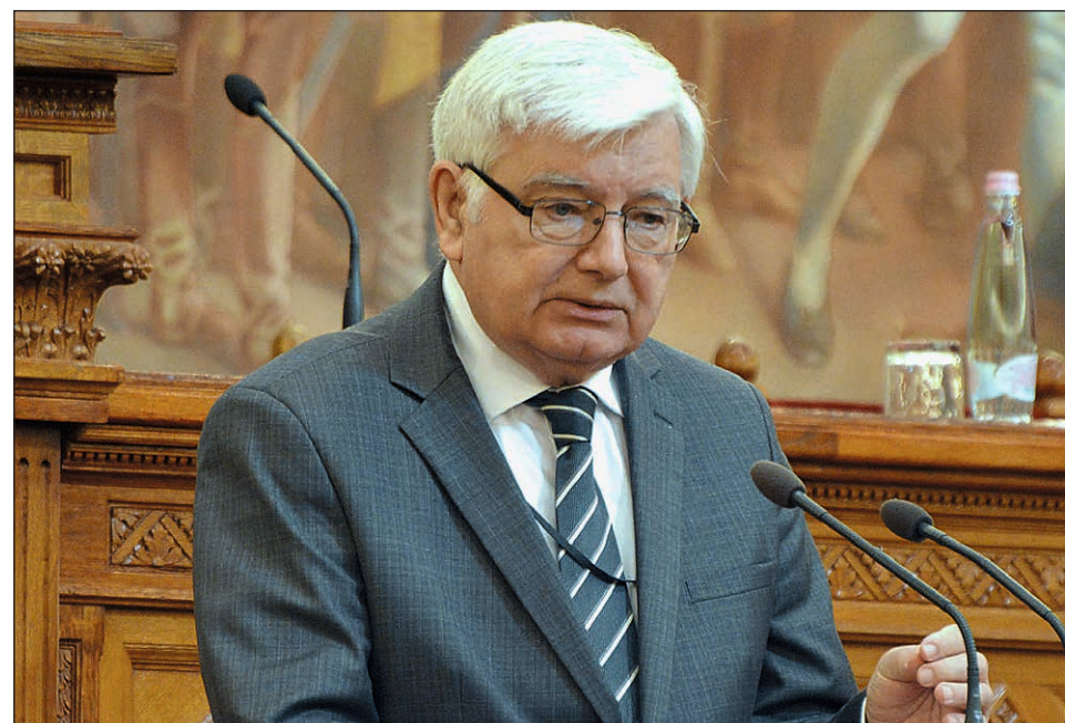
Surján László volt miniszter és EP-alelnök, a KDNP tiszteletbeli elnöke