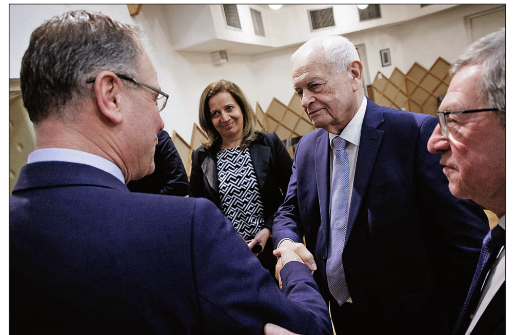
Navracsics Tibor területfejlesztési miniszter Szombathelyen