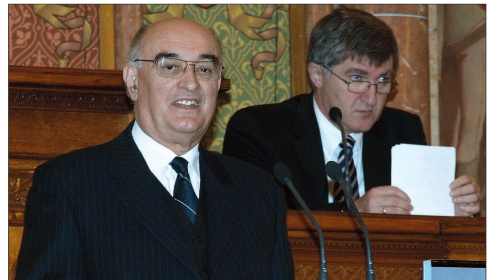
Szebik Imre evangélikus püspök