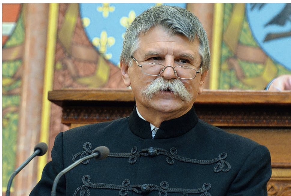
Kövér László, a Magyar Országgyűlés Elnöke