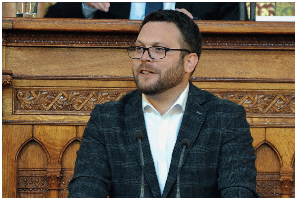
Schanda Tamás államtitkár, jelenleg a köztársasági elnök asszony kabinetfőnöke