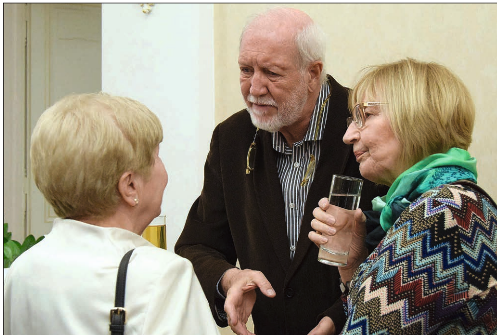
A Kereszténydemokrata Est vendégei Budapesten