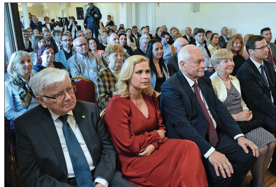
A Kereszténydemokrata Est résztvevői Budapesten