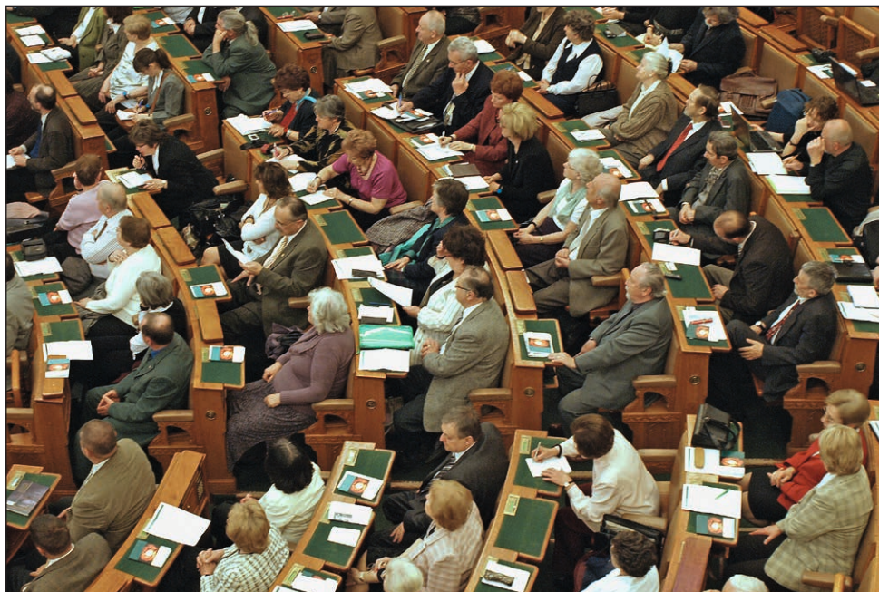
A Keresztény Civil Fórum résztvevői