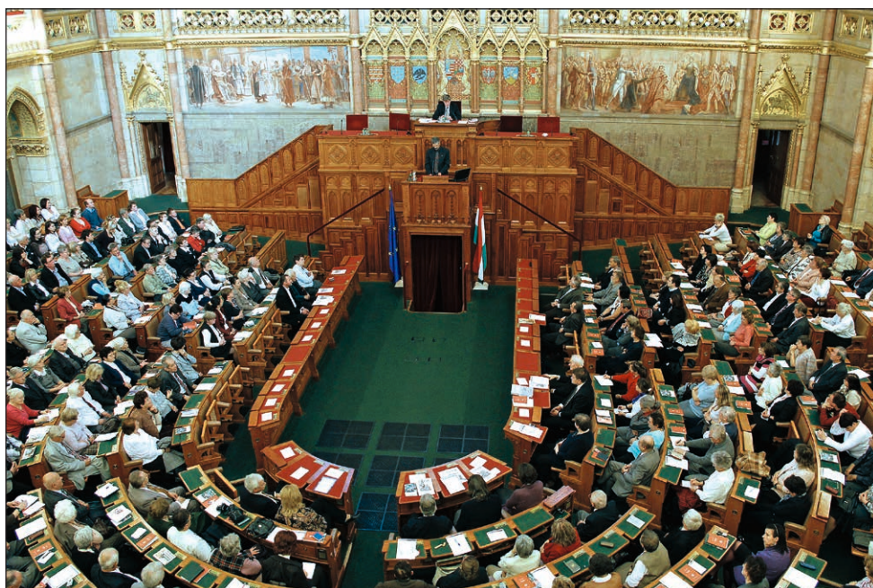
A Keresztény Civil Fórum résztvevői