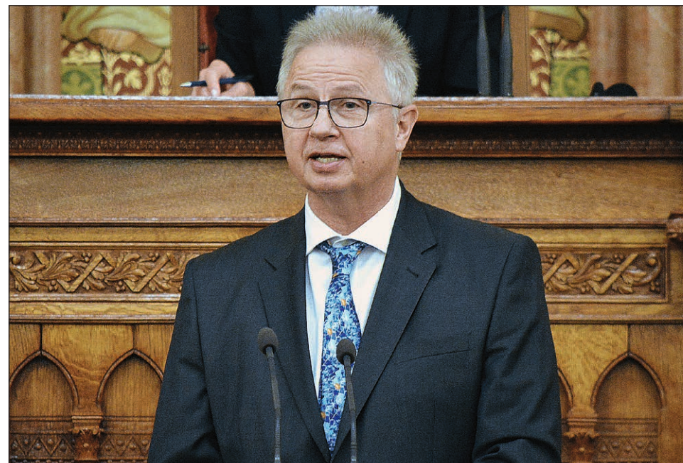
Trócsányi László igazságügyi miniszter