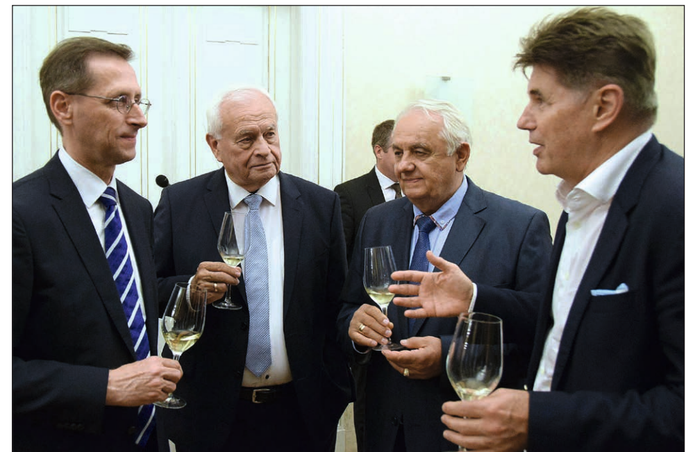
Varga Mihály pénzügyminiszter