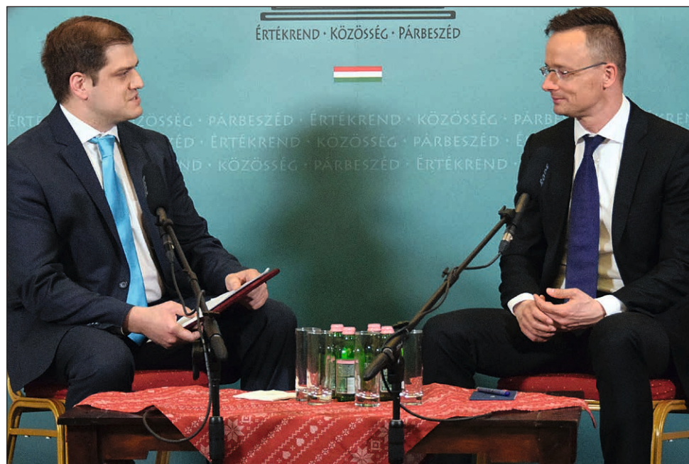
Szijjártó Péter külügyminiszter