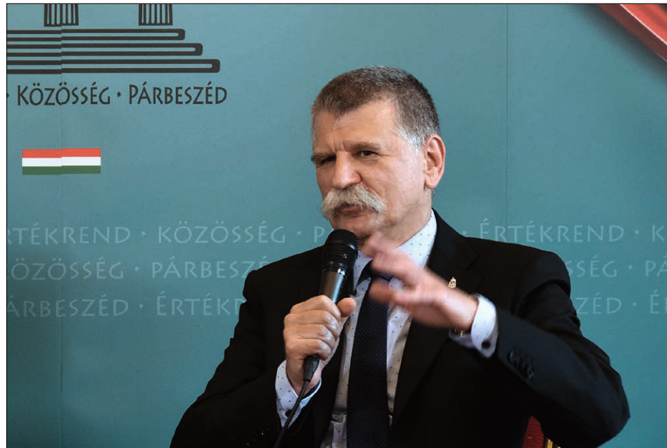
Kövér László, a Magyar Országgyűlés Elnöke