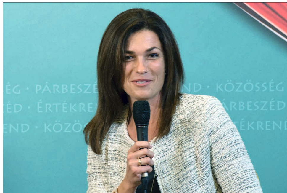
Varga Judit igazságügyi miniszter