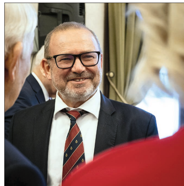
Lantos Csaba energiaügyi miniszter