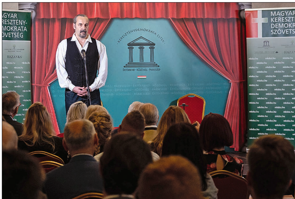
Turek Miklós színművész