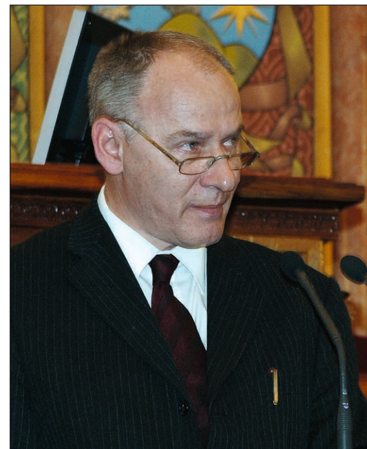
Bogárdi Szabó István református püspök