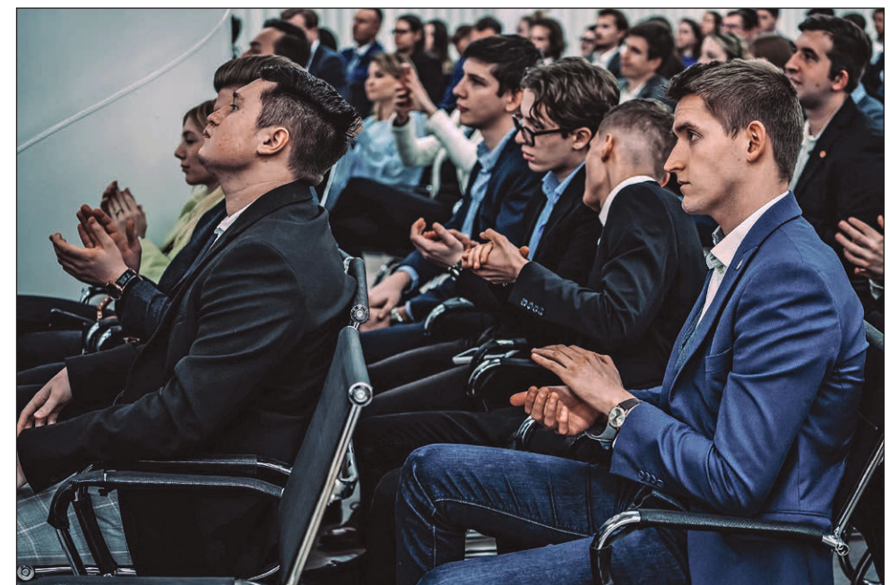
Közönségkép a Kerkai Estről