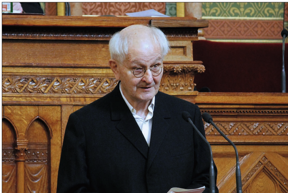
Jelenits István piarista szerzetes, teológus, író, tanár