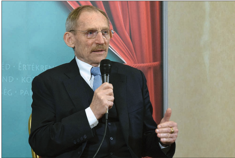
Pintér Sándor belügyminiszter