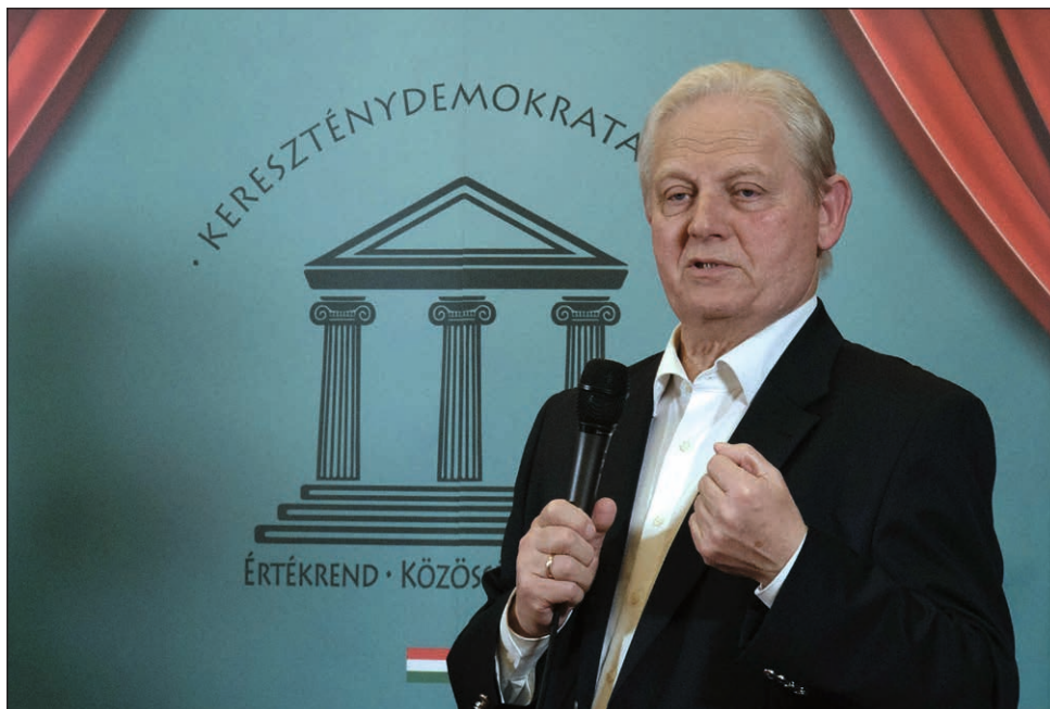
Tarlós István volt főpolgármester