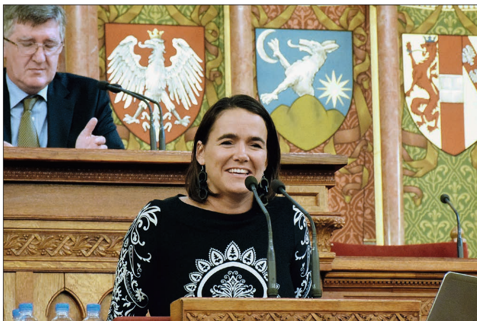
Novák Katalin volt miniszter, jelenlegi köztársasági elnök