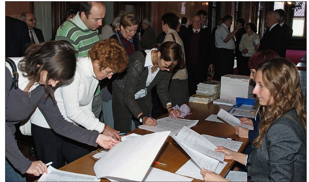
Regisztráció a Keresztény Civil Szervezetek Országos Fórumán

A képaláírásokban szereplő titulus alapesetben a rendezvény időpontjában betöltött tisztséget jelöli. Néhány esetben külön feltüntettük a jelenleg betöltött tisztséget is.