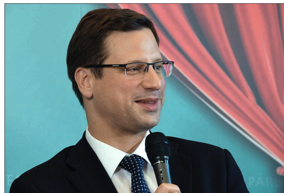
Gulyás Gergely kancelláriaminiszter