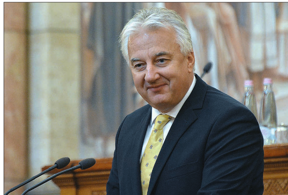
Semjén Zsolt miniszterelnök-helyettes, a Kereszténydemokrata Néppárt elnöke