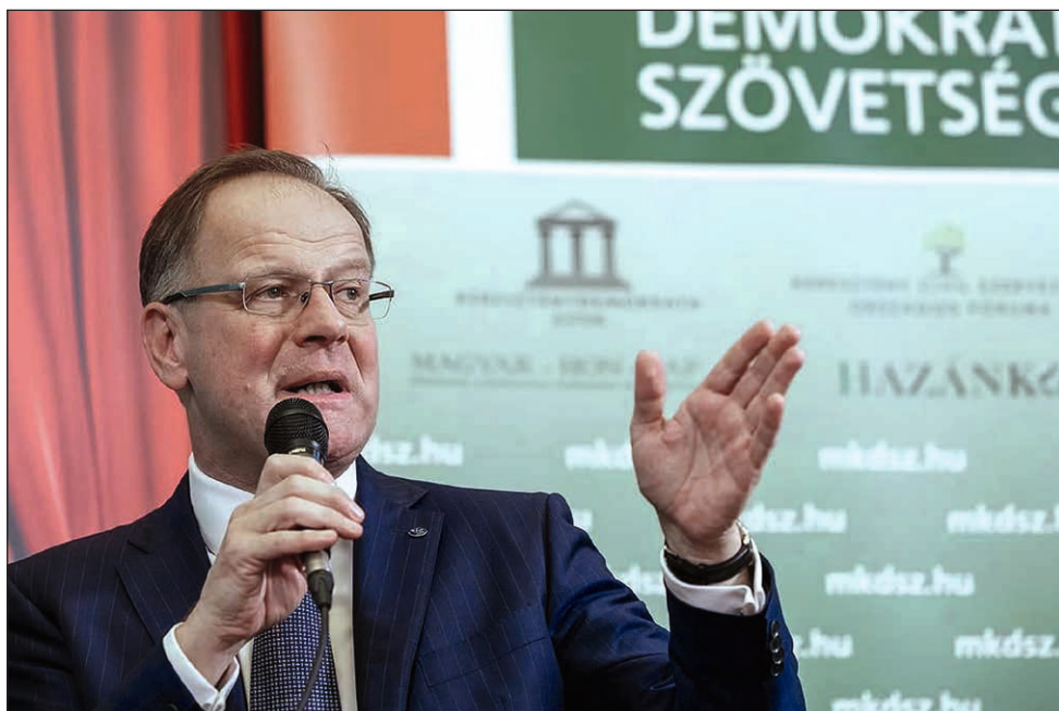
Navracsics Tibor területfejlesztési miniszter