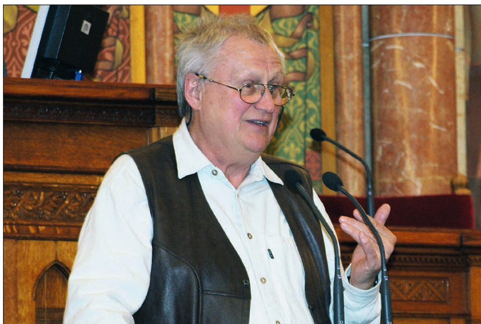
Czákó Gábor író