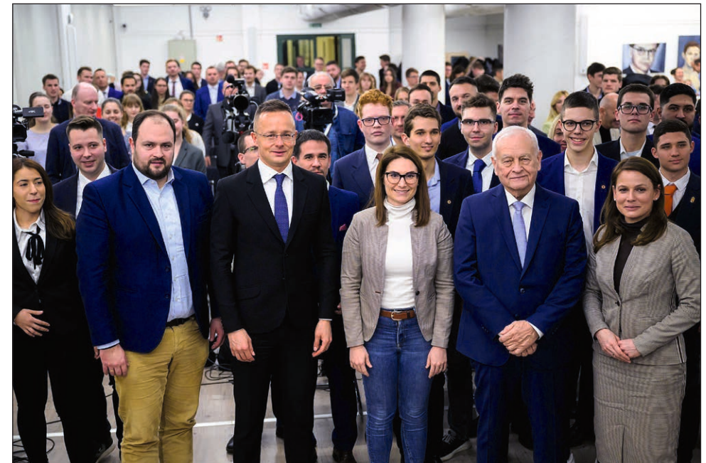
Csoportkép Szijjártó Péter külügyminiszterrel