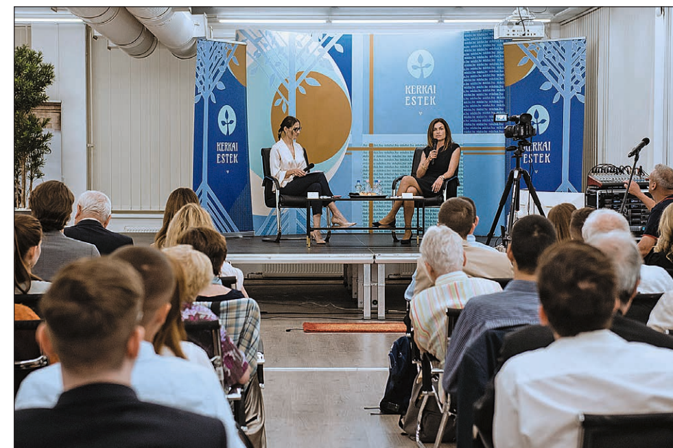
Déri Stefi Varga Judit igazságügyi miniszterrel beszélget