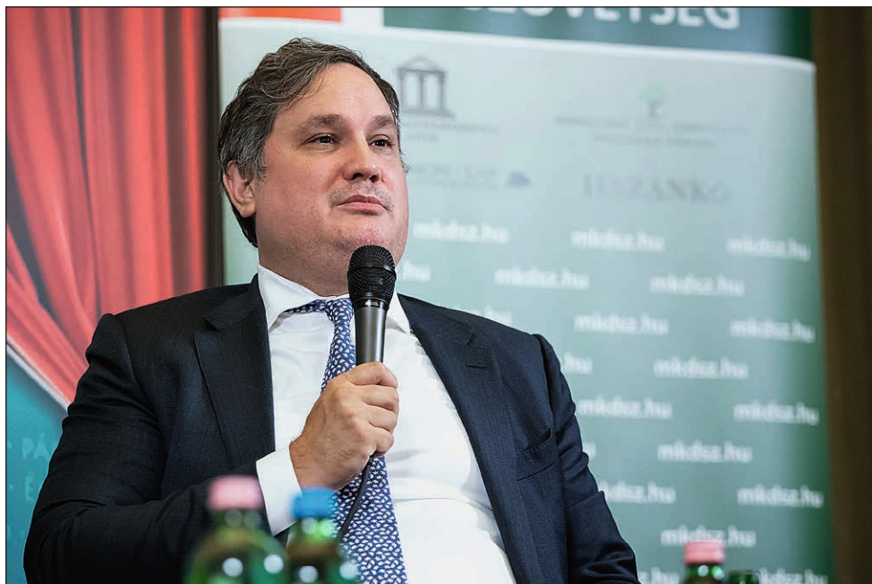
Nagy Márton gazdaságfejlesztési miniszter