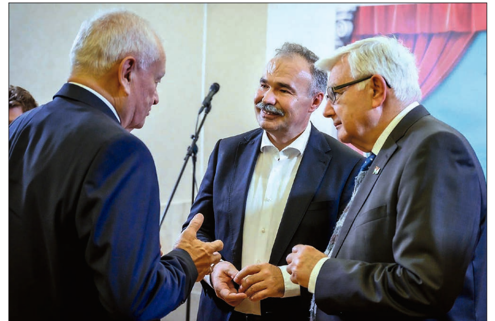
Nagy István agrárminiszter