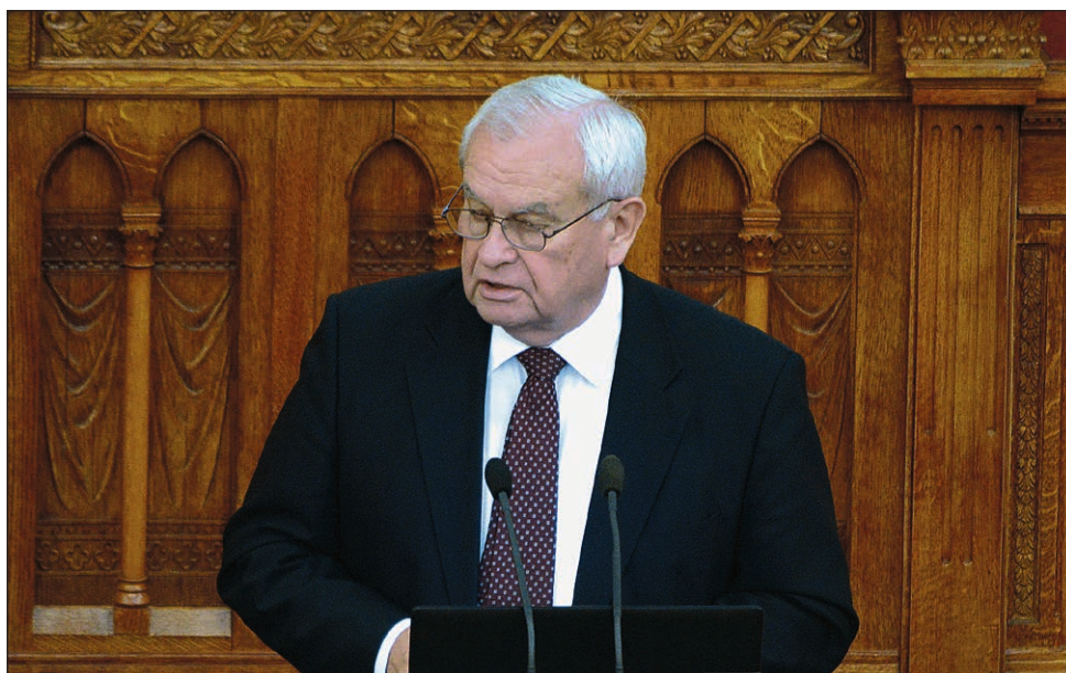
Harrach Péter, a Magyar Kereszténydemokrata Szövetség elnöke, a Keresztény Civil Fórum házigazdája