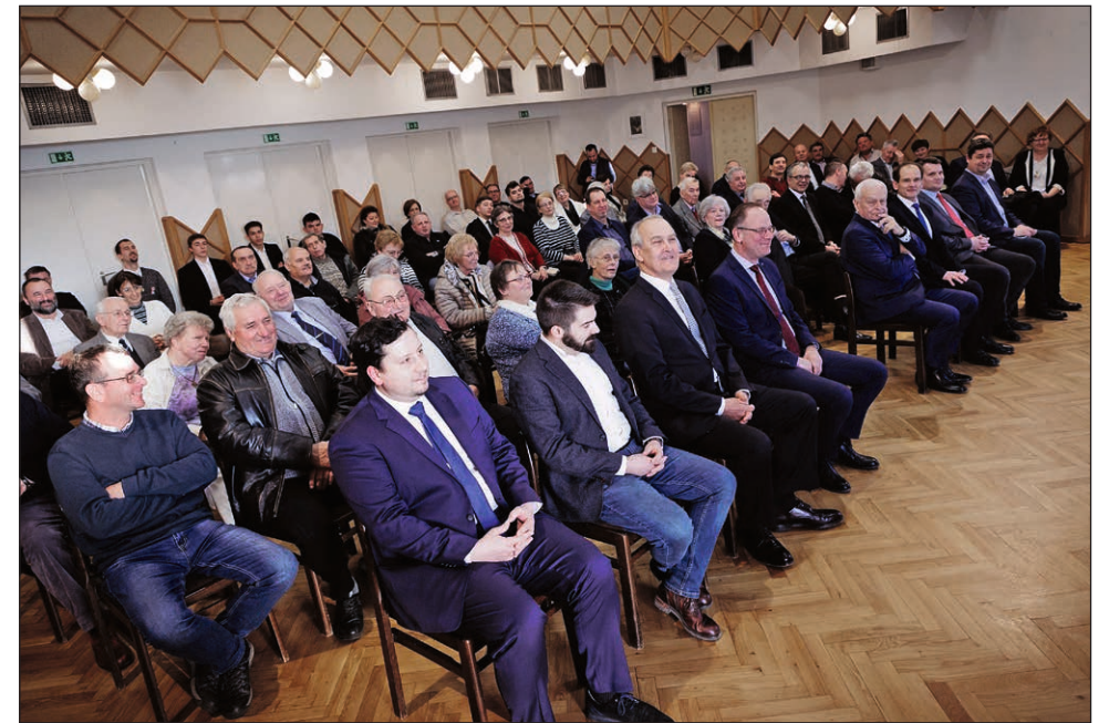
A Kereszténydemokrata Est résztvevői Szombathelyen