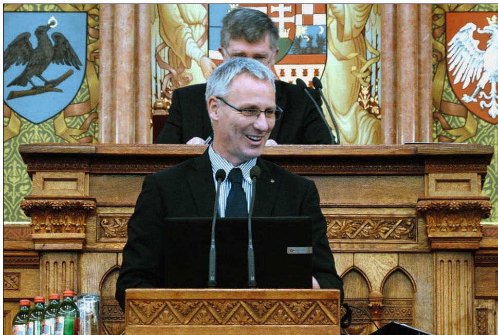
Soltész Miklós egyházi és nemzetiségi kapcsolatokért felelős államtitkár