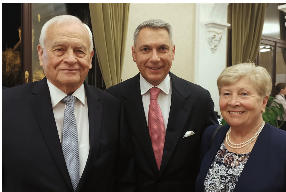
Lázár János építési és közlekedési miniszter