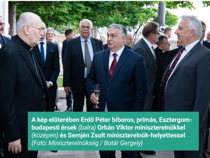
A kép előterében Erdő Péter bíboros, prímás, Esztergom-budapesti érsek (balra) Orbán Viktor miniszterelnökkel (középen) és Semjén Zsolt miniszterelnök-helyetttel

Erdő Péter köszöntése 70. születésnapján