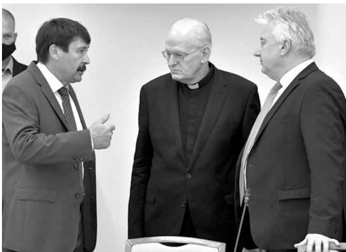
Áder János köztársasági elnök, Erdő Péter bíboros, Esztergom-budapesti érsek és Semjén Zsolt miniszterelnök-helyettes (balról jobbra) a magyar fővárosban szeptemberben kezdődő 52. Nemzetközi Eucharisztikus Kongresszus társadalmi bizottságának ülésén a Szent Máté Kulturális Központban 2021. június 2-án

A szentmisét megelőzően a tervek szerint a Szentatya külön fog találkozni a magyar állam vezetőivel, Áder János köztársasági elnökkel, Orbán Viktor miniszterelnökkel, a kormány tagjaival és más magas rangú állami vezetőkkel.